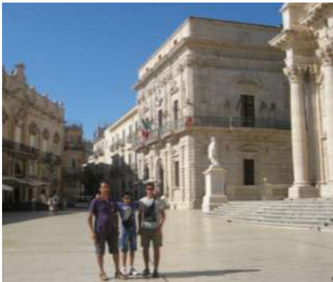
Siracusa - Duomo

Ripartiamo per Siracusa , attraverso l'autostrada che non è ancora a pagamento, e troviamo ancora poco traffico come in tutti questi giorni trascorsi in Sicilia (a parte quando raggiungiamo i centri urbani). Purtroppo al parcheggio Von Platen ci informano che nell'area non è possibile pernottare e che chiude alle 21. Ci portiamo allora con il camper al parcheggio "Molo Sant'Antonio". Tutto sommato anche se non abbiamo corrente e acqua è molto comodo perché si trova a pochi passi dall'Isola di Ortigia , davanti alla polizia di frontiera. Qui si fermano anche gli autobus e numerosi automobilisti.