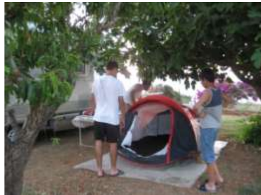
Scopello (spiaggia e area di sosta Fontana)