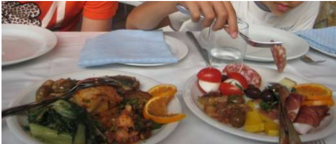
Ristorante a Taormina

Decidiamo di prendere quello delle 16.15 e passare la serata a Taormina. Visitiamo il teatro, in parte coperto per la preparazione di serate e concerti. Camminiamo per il centro che brulica di turisti, e vediamo anche degli sposi. Bellissima la vista del mare dall'alto. Mangiamo in un ottimo ristorante " La Piazzetta ".