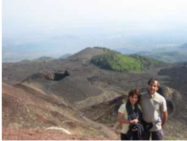
Crateri silvestri dell'ETNA

Dopo una bella passeggiata nel parco archeologico, ben curato e ricco di oleandri, (in tutto il biglietto costa 20 € solo per gli adulti), torniamo in camper per il pranzo. Per la strada abbiamo acquistato dell'ottima pizza da asporto in un forno/panificio.