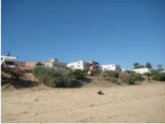
Punta Piccola Park - area di sosta