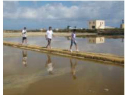
Saline di Trapani