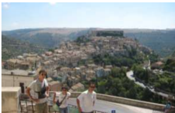
veduta di Ragusa Ibla