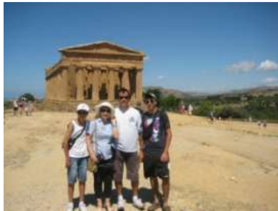
Valle dei Templi di Agrigento

Poi torniamo al camper dove mangiamo qualcosa di pronto. Ci rimettiamo in viaggio verso le 13.30 percorrendo la strada verso Caltanissetta e verso le 15.15 arriviamo a Piazza Armerina , dove c'è un grandissimo parcheggio con già 8 autobus, alcuni camper e varie macchine. I ragazzi sono stanchi e preferiscono rimanere in camper.