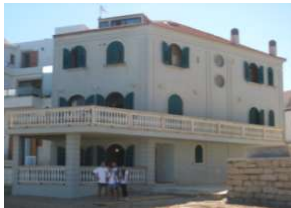
Punta Secca - casa di Montalbano

Sono ormai le 18.15 e partiamo per raggiungere Punta Secca , per arrivare verso le 20.00 nell'Agricampeggio di Capo Scalambri, a Santa Camerina. Ci sistemiamo proprio in riva al mare, anche se c'è molto vento. Qui sono tutti gentilissimi e appena arrivati ci regalano una borsetta di verdure fresche. Ordiniamo 4 pizze dalla Pizzeria "A Musciara" aperta da poco, e ce le portano direttamente nel campeggio. Riusciamo a collegare subito la tv per vedere Inghilterra-Uruguay del nostro girone. Si sta benissimo, siamo a pochi metri dalla spiaggia dove c'è anche la casa del Commissario Montalbano. Dormiamo davvero rilassati, sentendo solo il rumore del mare. Il posto è davvero tranquillo.