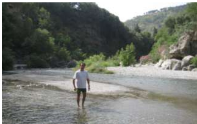
Gole di Alcantara

Partiamo per andare alle Gole di Alcantara che si trovano a 20 minuti dalla nostra Area di sosta. Il parcheggio non consente la sosta notturna ma ci chiedono solo un'offerta. Entriamo dall'accesso comunale, scendendo i gradini perché da questo lato è gratuito. Chi scende con l'ascensore paga (dalle 9 alle 12 €) per ritrovarsi nella nostra stessa "spiaggetta". L'acqua è gelida ma limpidissima, inoltre è severamente vietato oltrepassare i limiti segnati per la pericolosità della caduta di sassi. Passiamo una mattinata tranquilla, al sole e nell'acqua limpida delle Gole.