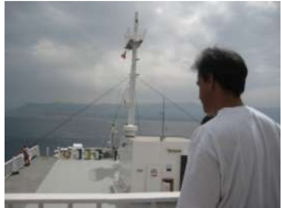
Lo stretto di Sicilia - vista della Calabria