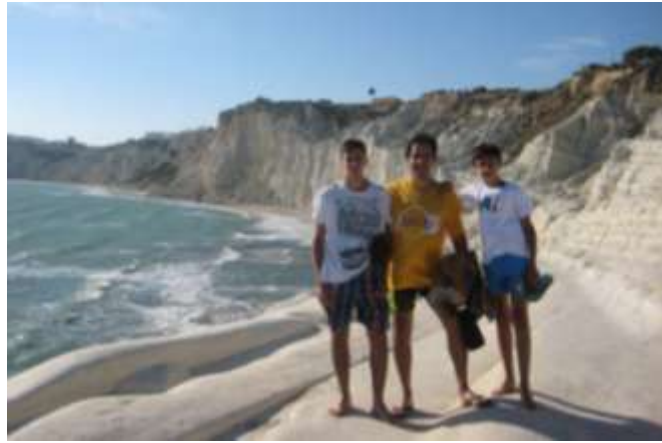
Scala dei Turchi