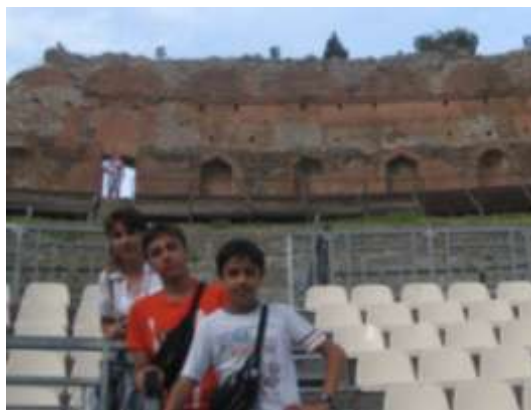
Taormina - Teatro

Rientriamo nell'area di sosta per il pranzo e decidiamo di rilassarci qualche ora. Proprio pochi metri dall'area di sosta partono i bus per Taormina .