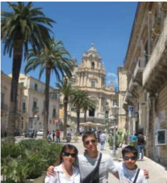
Ragusa Ibla - Duomo S. Giorgio

Torniamo verso il camper e parcheggiamo più in basso a Ragusa Ibla , la parte più vecchia della città e ricostruita quasi interamente dopo il terremoto del 1963. Passiamo per la Chiesa "Anime del Purgatorio", il Palazzo Sortino, fino ad arrivare al magnifico Duomo di S. Giorgio , dove assistiamo anche all'arrivo di una sposa. Continuiamo a passeggiare per il centro e vediamo la Chiesa di S. Giuseppe fino ad arrivare ai Giardini Iblei, ben curati e ombreggiati dove c'è anche una Chiesa bellissima che visitiamo.