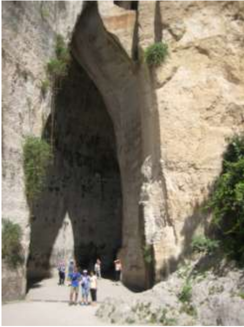
Orecchio di Dionisio

per la sua forma particolare. Un gruppo di olandesi intona un bel canto e si sente amplificato in maniera incantevole quasi commovente.